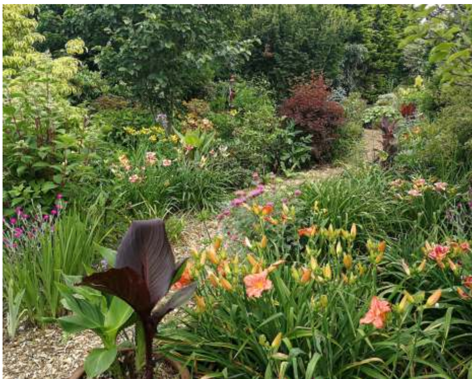
Tuin Berendina Visser