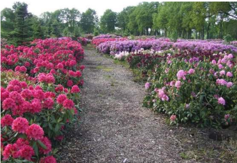
PARK GRAVELAND in WIJSTER