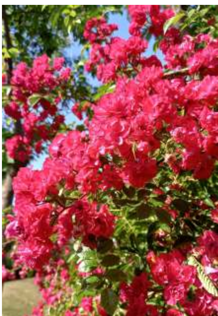
Tuin Stikfort Natuur en Tuin Schotsman