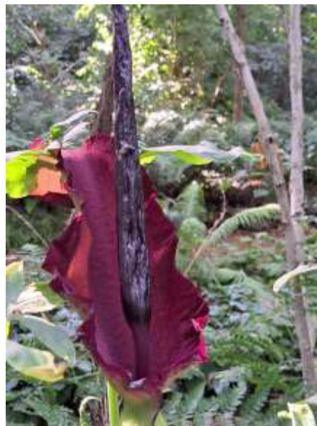
Natuur en Tuin

Heb je belangstelling neem dan voor 15 januari contact op met Martien Vossen (06 25081369) of mail naar info@midden-groningen.groei.nl .