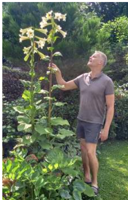
Tuin Bernard Stikfort