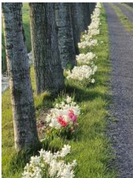
Laan Nauta en Blauw